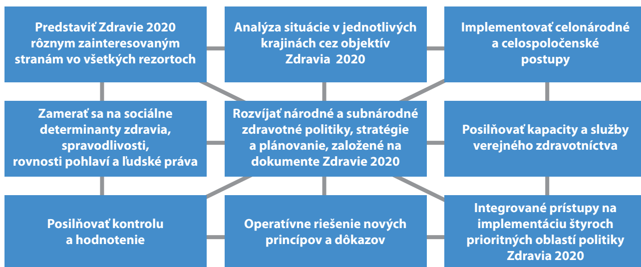
Obr. 2. Deväť zložiek v balíku Zdravie 2020

Východiskovým bodom pre všetky krajiny musí byť vypracovanie národnej zdravotnej politiky aj s jej podpornými stratégiami a plánmi. Vychádzajúc z dôkladného posúdenia potrieb, aké sú očakávaná krajín pokiaľ ide o spravodlivé zlepšenie zdravia? Aké multirezortné politiky a stratégie budú používať, napríklad pre neprenosné ochorenia? Balík nástrojov Zdravie 2020 má za úlohu pomáhať práve v tom. Pokiaľ ide o verejné zdravie, jasné pokyny poskytuje aj analýza Európskeho akčného plánu pre posilnenie kapacít a služieb verejného zdravia a s ňou súvisiaci nástroj samohod-