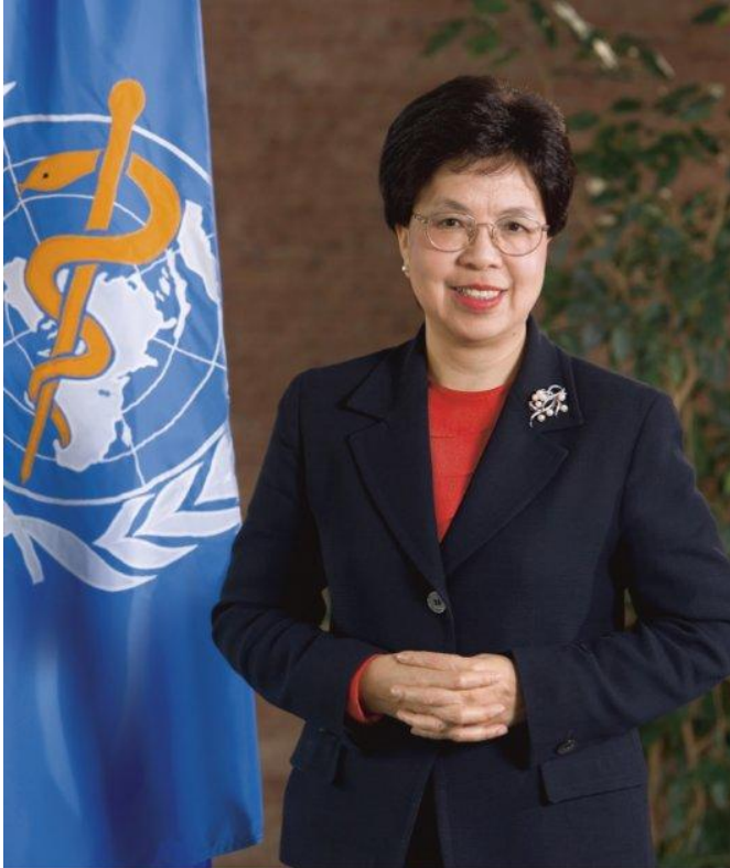
Dr Margaret Chan