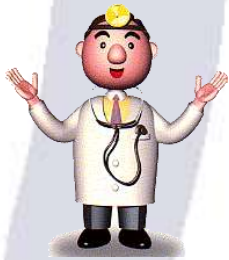
MUDr. Výmenný Lístok