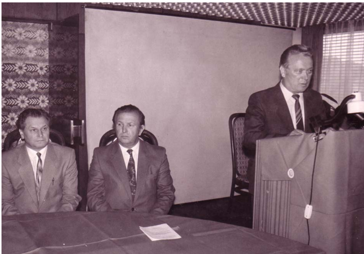
44. Michalovce 20.- 21.10.1988, Interhotel Družba